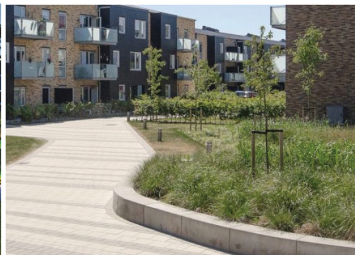
Forbedrede adgangs- og stiforløb